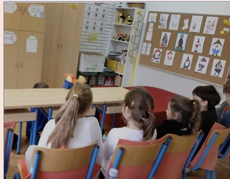
U razrednom kazalištu