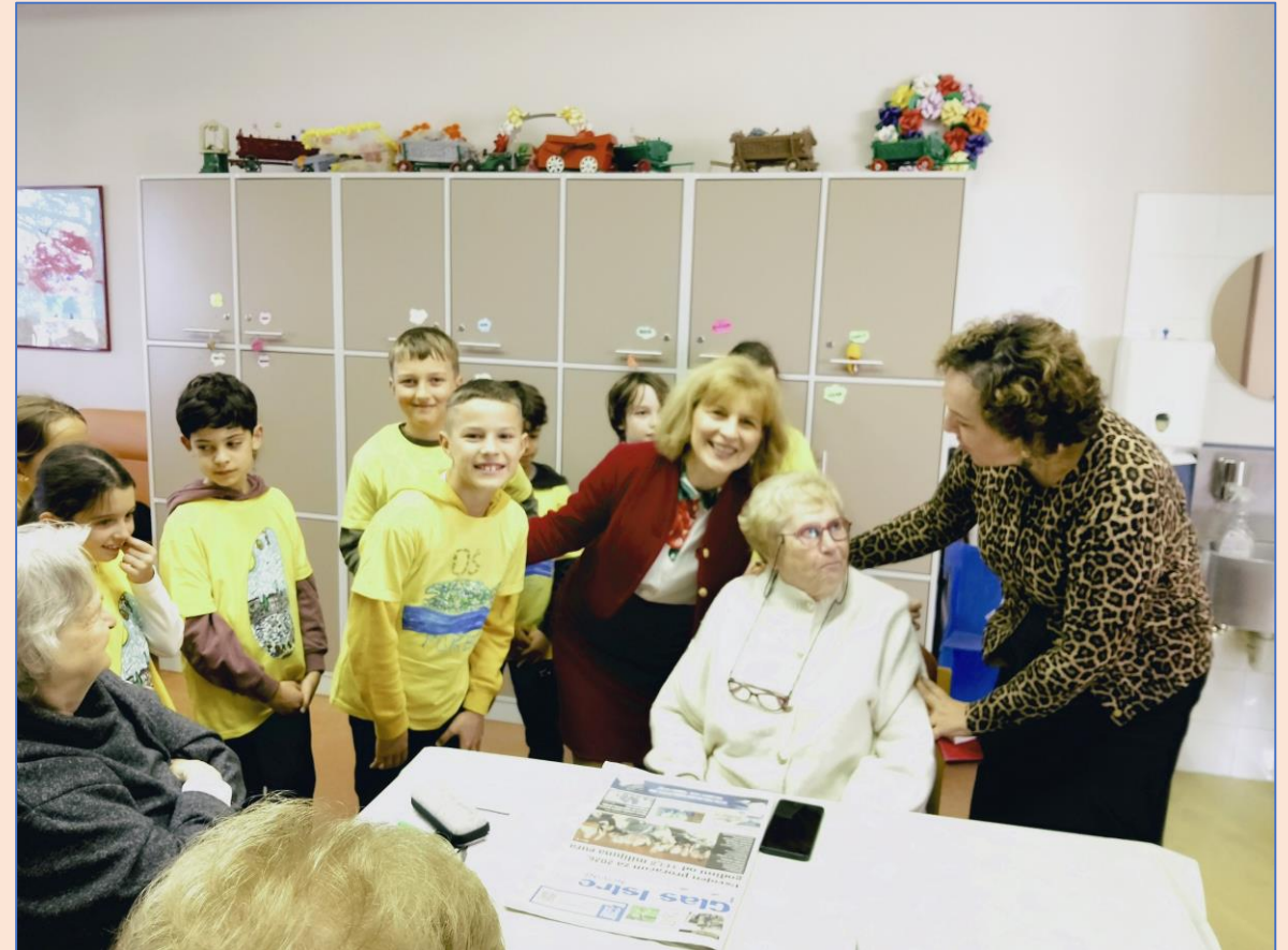
Druženje s umirovljenicima