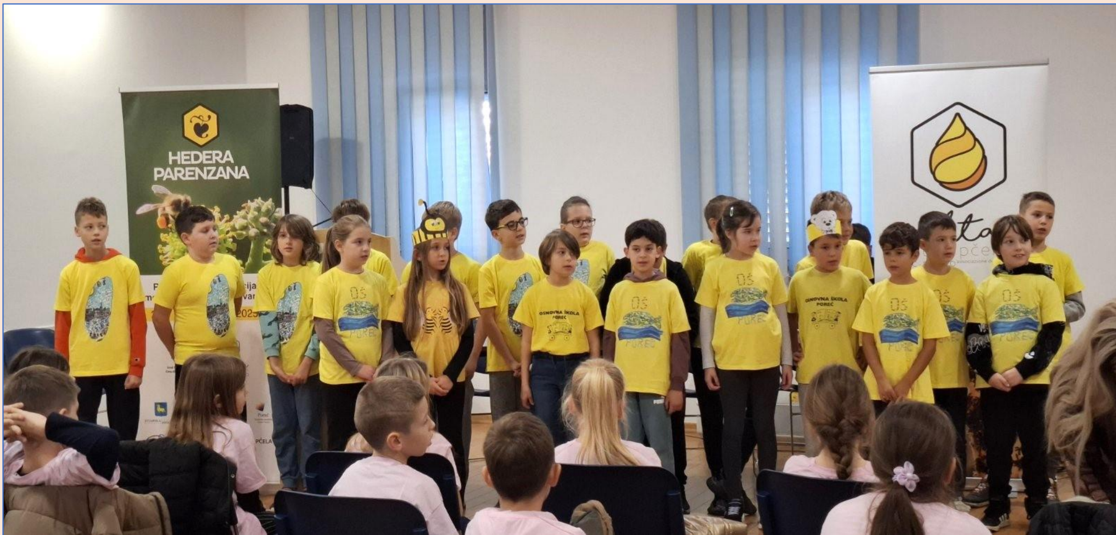
Na otvorenju Festivala meda u Poreču, 7. grupa PB