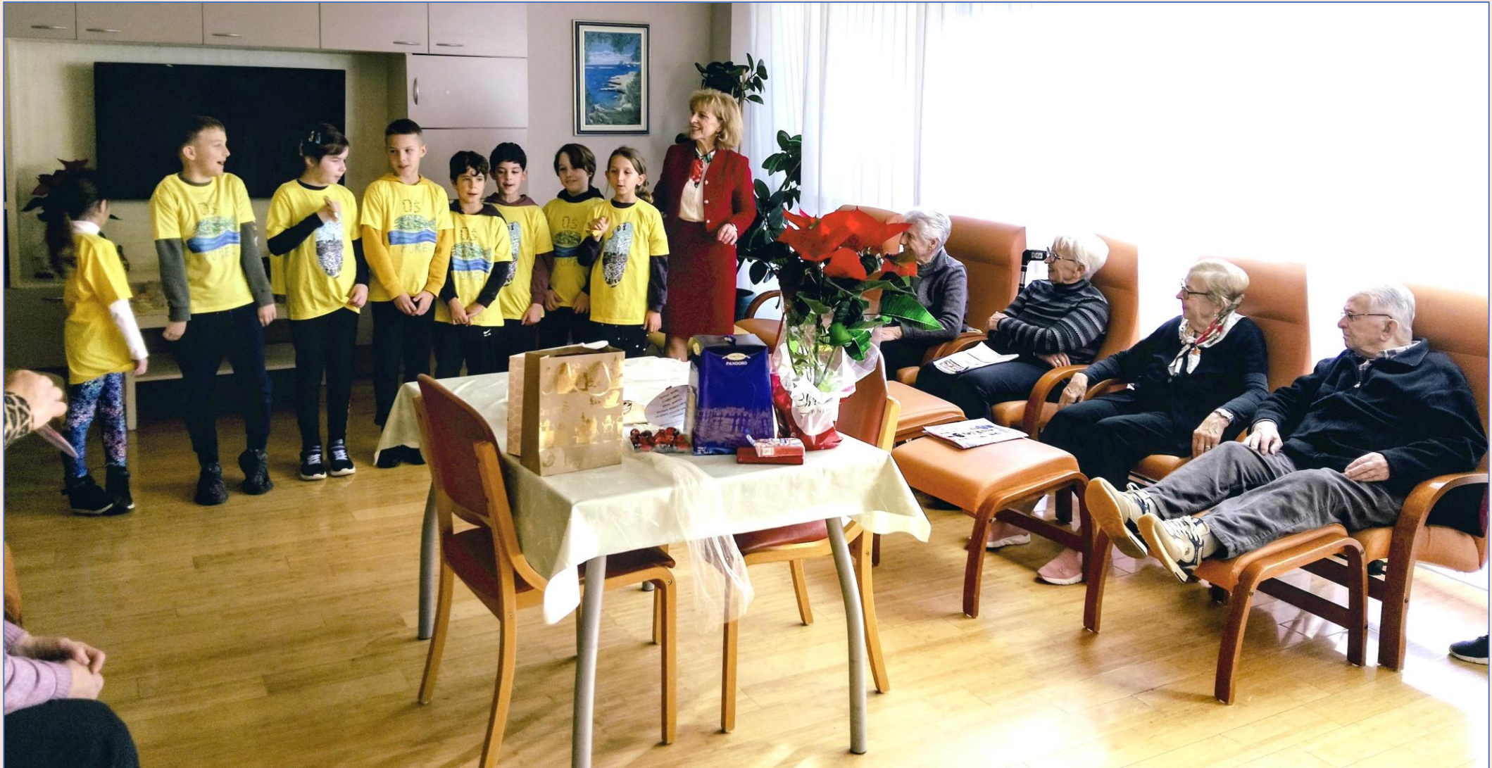
U Domu umirovljenika, 12. 12. 2025.