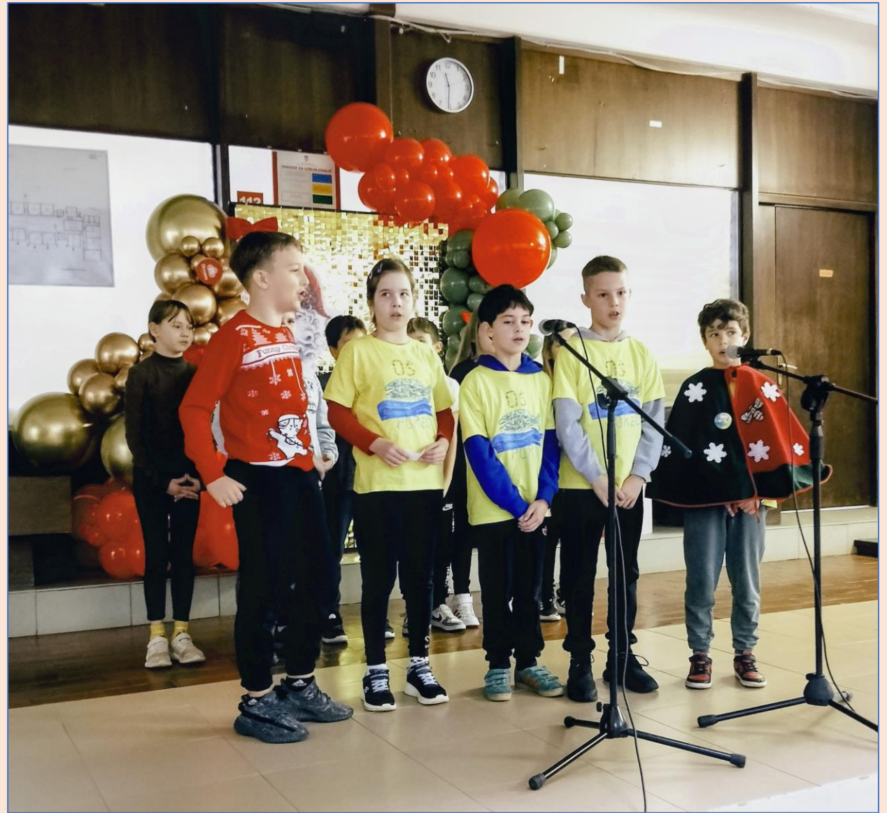
Na dočeku Djeda Mraza